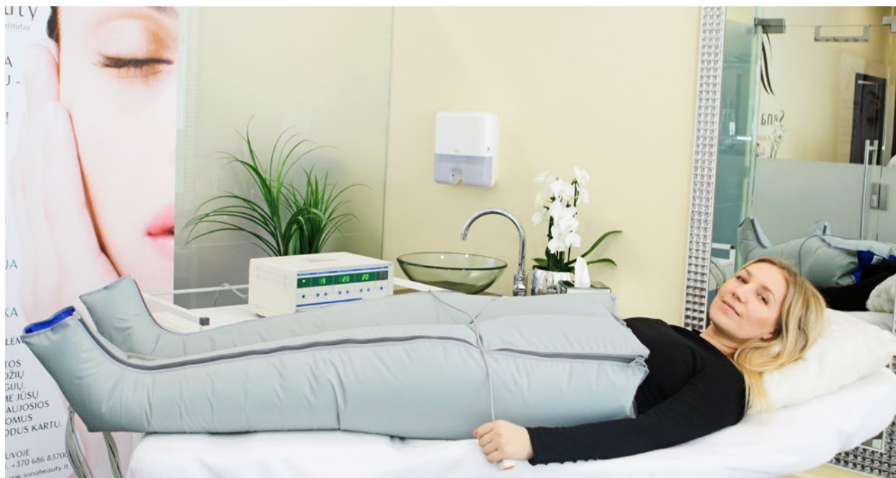
Die Kombination der RF- mit einer Lymphdrainagebehandlung soll für schnellere Behandlungserfolge sorgen. Hier trägt die Autorin den Lymphdrainageanzug.

BODYFORMING MIT RF UND LYMPHDRAINAGE – Radiofrequenz ist ein effektives Verfahren zur Hautstraffung im Kosmetikinstitut und lässt sich bei verschiedenen Problemzonen anwenden. Entscheidend für den Behandlungserfolg sind dabei die Wahl des richtigen Geräteaufsatzes und die Anzahl der Sitzungen.